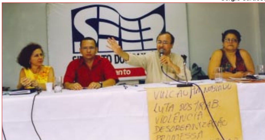
A CONJUNTURA FOI DEBATIDA PELOS BANCÁRIOS DO BB E DA CEF

Por fim, os bancários da CEF no Espírito Santo defendem que o Conecef permaneça como a estrutura máxima de deliberação dos empregados.