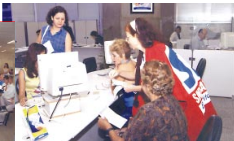
DIRETORES DO SINDICATO PERCORRERAM AS AGÊNCIAS DO CENTRO DE VITÓRIA DIA 6