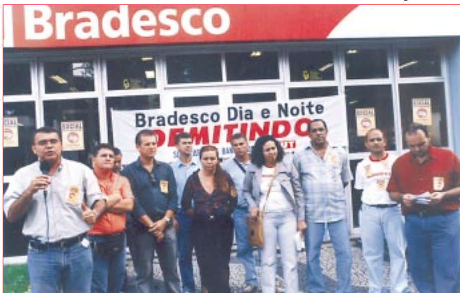
A AGÊNCIA DO BRADESCO DE VILA VELHA FICOU FECHADA POR DUAS HORAS