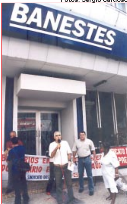
PARALISAÇÃO NO BANESTES VILA VELHA