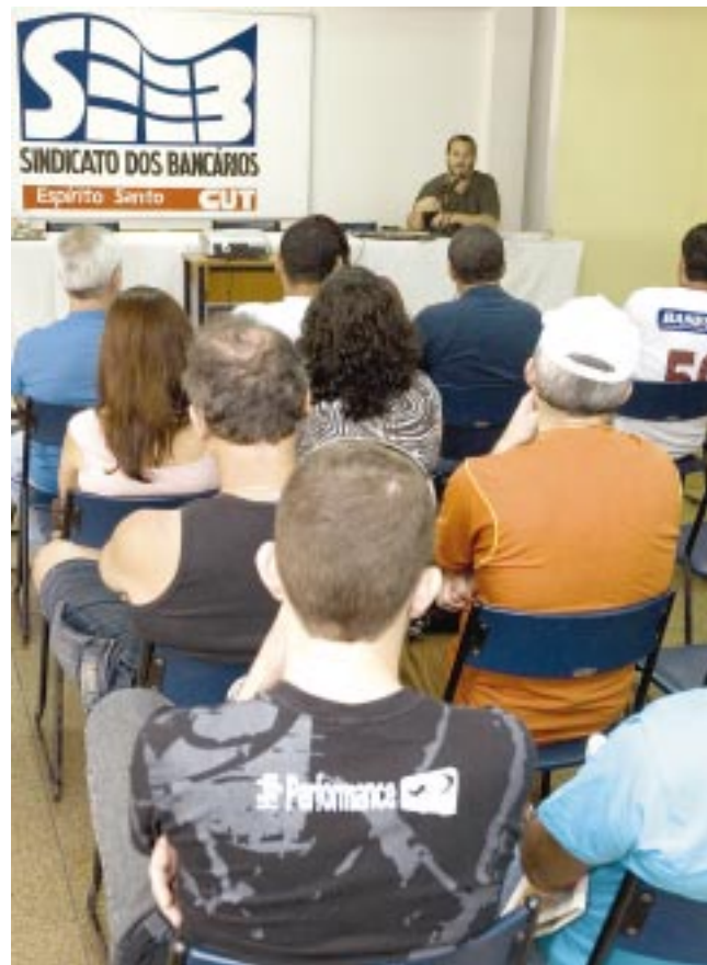
UMA ANÁLISE DE CONJUNTURA ABRIU OS ENCONTROS

A Campanha 2007 no Banestes deverá ser centrada na luta para resgatar os direitos específicos e por avanços nas cláusulas sociais. Como a Campanha 2006 ainda não foi fechada, os bancários vão buscar a assinatura de dois acordos: um referente a 2006/2007 e o outro a 2007/2008. A reposição das perdas salariais históricas mais a inflação do período devem ser as reivindicações econômicas.