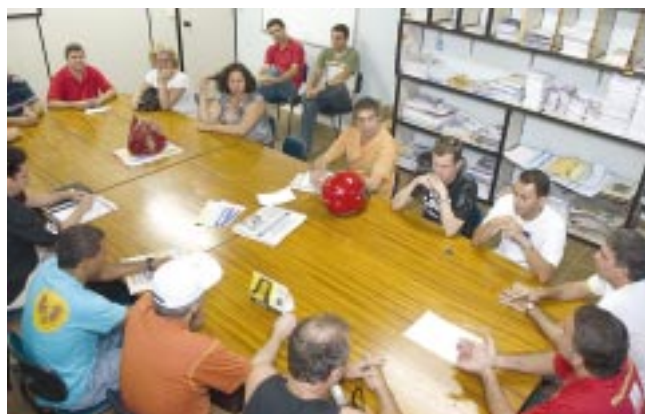
BANCOS PRIVADOS: COMBATE À PRESSÃO POR METAS