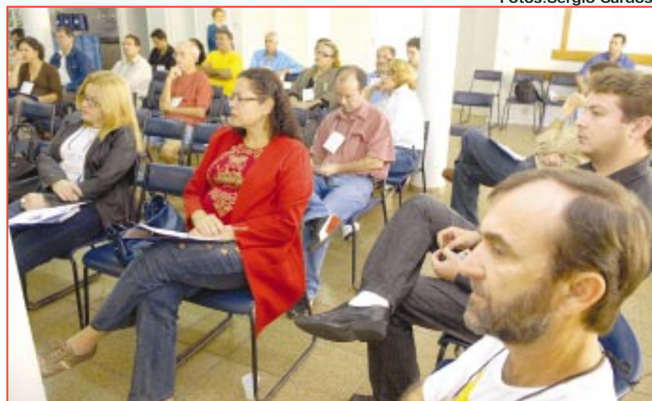
O CONGRESSO REUNIU BANCÁRIOS DO BB E DA CEF