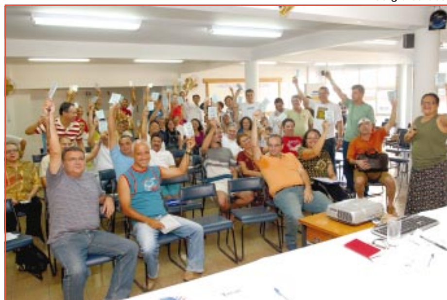
AS PROPOSTAS APROVADAS SERÃO LEVADAS À APRECIÇÃO NACIONAL

Como estratégia para a Campanha 2007, os capixabas indicam a unificação da categoria em torno de uma pauta comum e o encaminhamento de pautas específicas para os bancos públicos. A negociação deverá se dar na mesa única da Fenaban e também nas mesas específicas. O Comando Nacional, na avaliação dos capixabas, deverá ser eleito num encontro nacional aberto, para que as diversas correntes de pensamento presentes na categoria tenham oportunidade de estar representadas. Os eixos da Campanha devem ser: isonomia de direitos entre os bancários, reposição de perdas salariais, fim das metas abusivas, defesa dos bancos públicos e