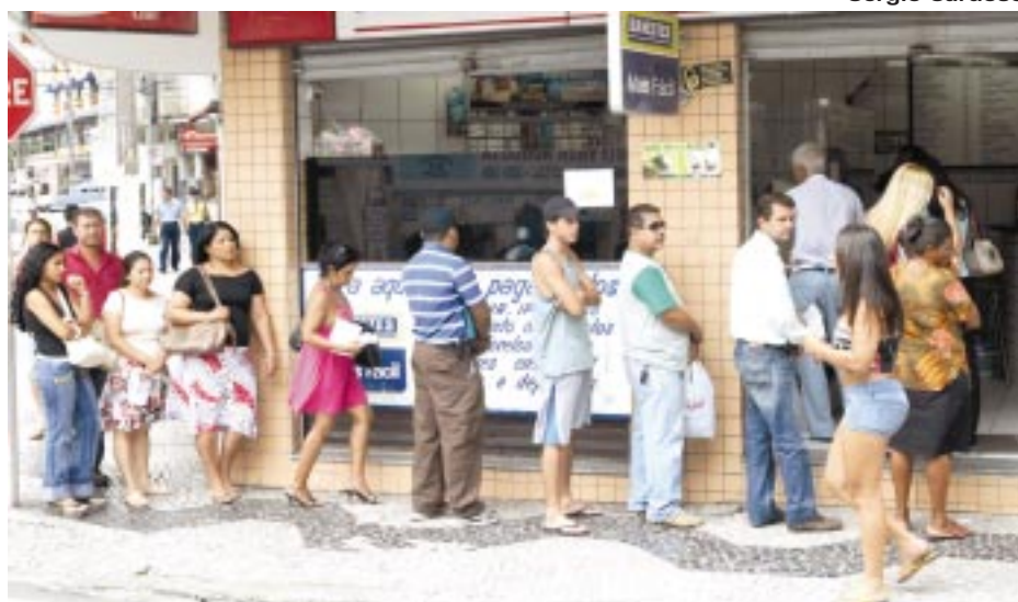
INSEGURANÇA: FILA PARA PAGAR CONTAS NA CALÇADA DE UMA LANCHONETE