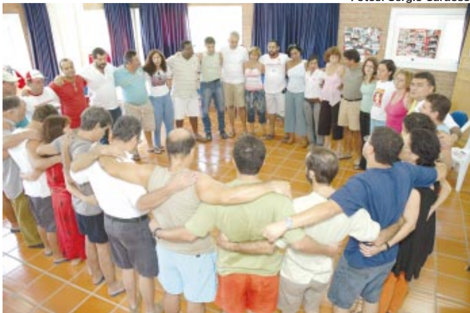
ENCERRAMENTO DO CURSO DE FORMAÇÃO REALIZADO EM 2004