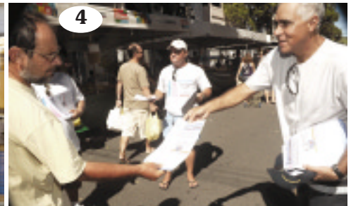
Diretores do Sindicato fazem panfletagem e conversam com a população: fotos 1 e 4, na feira de Jardim da Penha; foto 2, no comércio de Campo Grande; foto 3, na feira de Aribiri